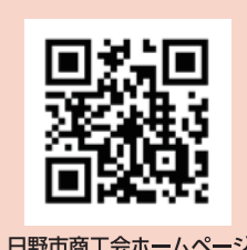
日野市商工会ホームページ